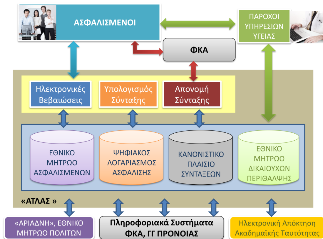
Σχήμα1: Απεικόνιση Δομής Συστήματος «ΑΤΛΑΣ»

Στο σχήμα 1 αποτυπώνεται η αρχιτεκτονική του συστήματος «ΑΤΛΑΣ».