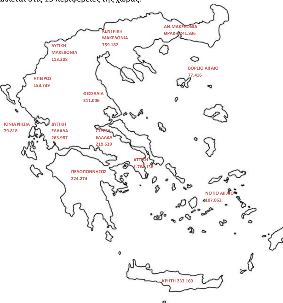
Χάρτης 1: Καταβολή Συντάξεων ανά Περιφέρεια

Για 27.401 εγγραφές δεν υπήρχε ένδειξη ΤΚ και για το λόγο αυτό δεν περιλαμβάνονται στον Πίνακα 7. Στο χάρτη που ακολουθεί αποτυπώνεται ο αριθμός των συντάξεων που καταβάλλεται στις 13 περιφέρειες της χώρας.