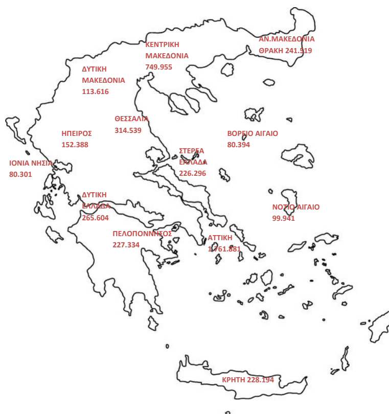
Χάρτης 1: Καταβολή Συντάξεων ανά Περιφέρεια

Στον Πίνακα 17 αποτυπώνονται τα ποσά σύνταξης που αντιστοιχούν σε κάθε Περιφέρεια σε σχέση με το αντίστοιχο ΑΕΠ για το έτος 2013 (προσωρινά στοιχεία ΕΛΣΤΑΤ). Σύμφωνα με τα δεδομένα του Πίνακα 17, στην Περιφέρεια Ηπείρου παρατηρείται η μεγαλύτερη τιμή (22,2%) του λόγου ποσού σύνταξης προς ΑΕΠ και ακολουθεί η Περιφέρεια Θεσσαλίας με τιμή 20,2%. Στην τελευταία θέση βρίσκεται η Περιφέρεια Νοτίου Αιγαίου με τιμή 10,3%.