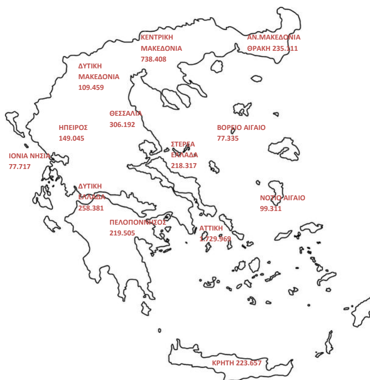
Χάρτης 1: Καταβολή Συντάξεων ανά Περιφέρεια

Στον Πίνακα 25 αποτυπώνονται τα ποσά σύνταξης που αντιστοιχούν σε κάθε Περιφέρεια σε σχέση με το αντίστοιχο ΑΕΠ για το έτος 2013 (προσωρινά στοιχεία ΕΛΣΤΑΤ). Σύμφωνα με τα δεδομένα του Πίνακα, στην Περιφέρεια Ηπείρου παρατηρείται η μεγαλύτερη τιμή (21,6%) του λόγου ποσού σύνταξης προς ΑΕΠ και ακολουθεί η Περιφέρεια Θεσσαλίας με τιμή 19,6%. Στην τελευταία θέση βρίσκεται η Περιφέρεια Νοτίου Αιγαίου με τιμή 10,2%.