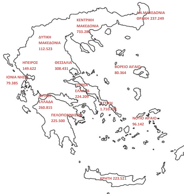
Χάρτης 1: Καταβολή Συντάξεων ανά Περιφέρεια

Στον Πίνακα 9 αποτυπώνονται τα ποσά σύνταξης που αντιστοιχούν σε κάθε Περιφέρεια σε σχέση με το αντίστοιχο ΑΕΠ για το έτος 2010 (προσωρινά στοιχεία ΕΛΣΤΑΤ). Σύμφωνα με τα δεδομένα του Πίνακα 9, στην Περιφέρεια Ηπείρου παρατηρείται η μεγαλύτερη τιμή (17,5%) του λόγου ποσού σύνταξης προς ΑΕΠ και ακολουθεί η Περιφέρεια Θεσσαλίας με τιμή 17,1%. Στην τελευταία θέση βρίσκεται η Περιφέρεια Νοτίου Αιγαίου με τιμή 7,8%.